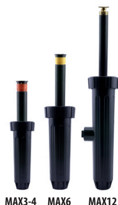
MAX3-4 MAX6 MAX12