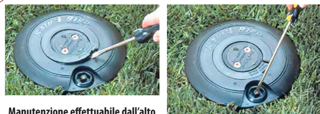
Manutenzione effettuabile dall'alto